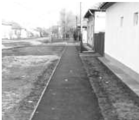
A Baross utca új járdaszakasza

3. Nyertes HÖF-TEKI pályázat segítségével 2008 végén mintegy 17 millió Ft értékben került sor járdaépítésekre a város belterületén. A kb. 1941 m 2 területet érintő beruházás keretében a Kossuth