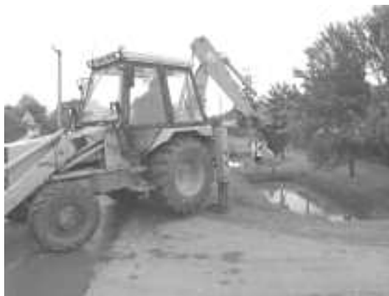
Belvívészdelmi védekezés Kisújszálláson