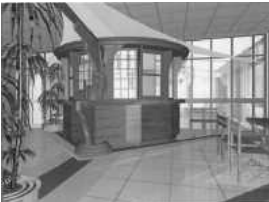
Látványterv az új fürdő előcsarnokáról

...És hogy mi lesz az eredménye? Egy szép és modern, fedett fürdőgyógyászati komplexum, benne egy több mint kétezer négyzetméteres, galériás medencetérrel. Itt lesz a gyógy- és a jelenlegi 1,40-es medence. Egy kb. hétszáz négyzetméteres kiszolgáló részleget is építünk, ezek együtt nyújtanak majd kellemes és gyógyító szolgáltatásokat. Itt lesz a fizioterápia, lesz súlyfürdő, gyógykád, fény- és aromaterápiára alkalmas gyógy- és wellnesskád. Épül egy többfunkciós gyógytorna- és élménymedence izgalmas élményelemekkel: masszázsfallal, dögönyözővel, középszópaddal, buzgárral. A szauna kedvelőit igazi „szaunavilág” várja majd a finn- és az infrasaunában, sőt lesz gőzkabin is. Új kezelőhelyeket is kialakítunk, több elektroterápiás iszap- és masszázskelölőhely lesz.