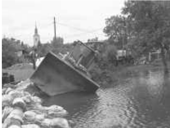
A homokzsákok, a gépek és a víz harca Ónodon