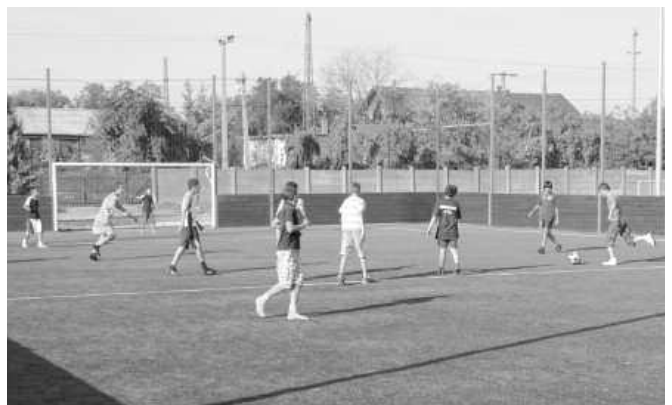
A gyermek kispályás labdarúgó-bajnokság résztvevői