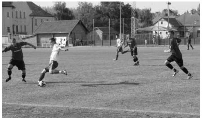
Kisújszállási SE-KUTE bajnoki labdarúgó-mérkőzés