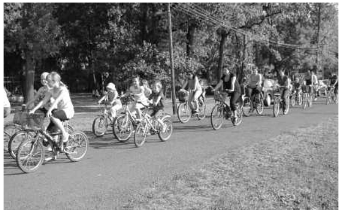
Bringás felvonulók az Erzsébet királyné ligetnél