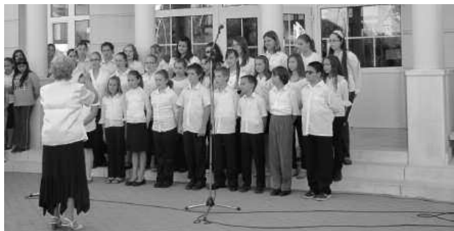
A Kossuth-iskola zenei nagykórusa egy napfényes, kora őszi délutánon