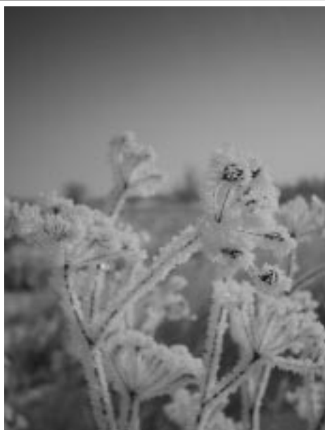
Csonttá fagyott vadmurom