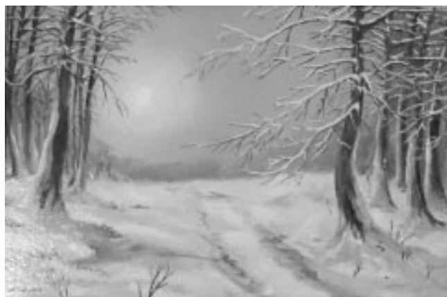
Téli táj - Tóth Tünde festménye