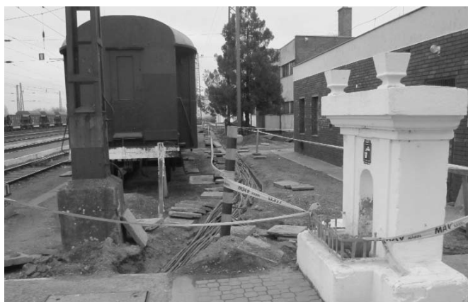
A kisújszállási munkálatok kivitelezése még ezután kezdődik