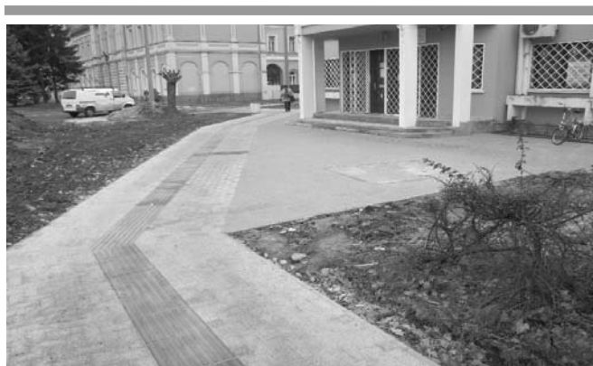
A városközpont felújítása: a Takarékszövetkezet előtt már elkészült az új járdafelület