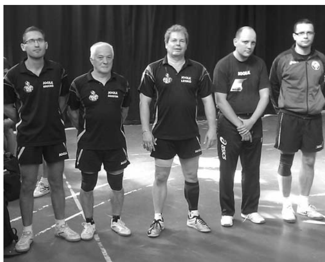
A kisúji asztaliteniszezők sikeres csapata