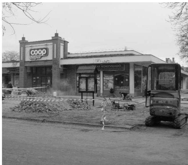
A városközpont felújítása: folynak a munkálatok az ABC körül