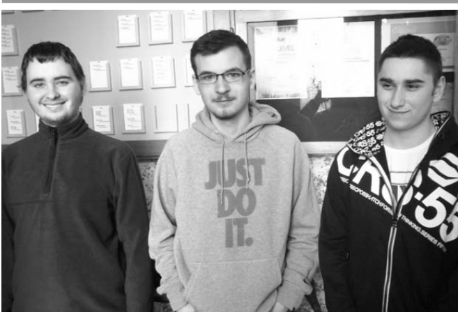
A képen balról jobbra: